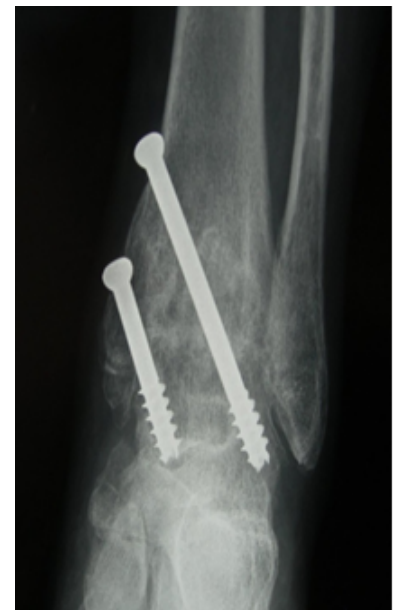
Patienten met een versleten

enkel ervaren pijn in het enkel gewricht met name bij belasten. De enkel is vaak ook dik. Stevige schoenen geven aanvankelijk klachten vermindering maar met het toenemen van slijtage zal het effect van schoenen vaak verminderen en uiteindelijk onvoldoende worden. Hierdoor zal een operatie om het gewricht vast te zetten noodzakelijk zijn.