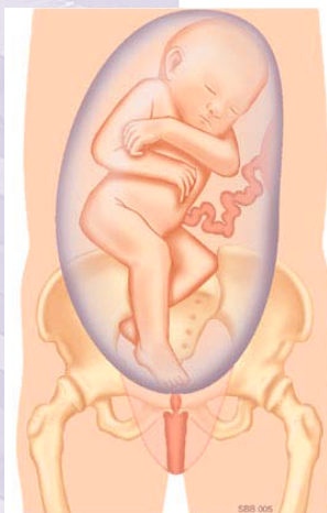
Fig. 1c: Half (on)volkomen stuitligging: één been